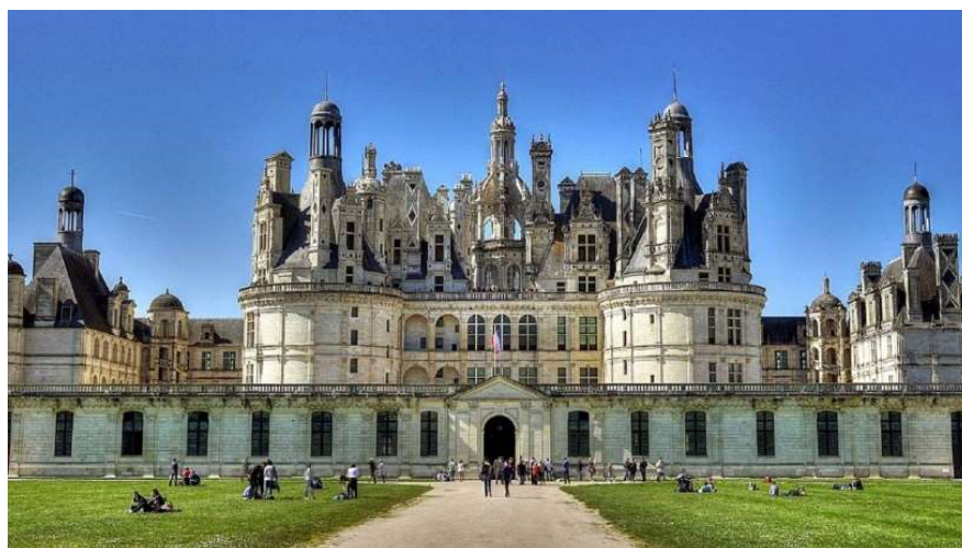
ALLEE ROYALE SUD

A 11 H 15 : Accès et Stationnement des voitures et motos par l'allée ROYALE SUD sur les pelouses face au château de Chambord